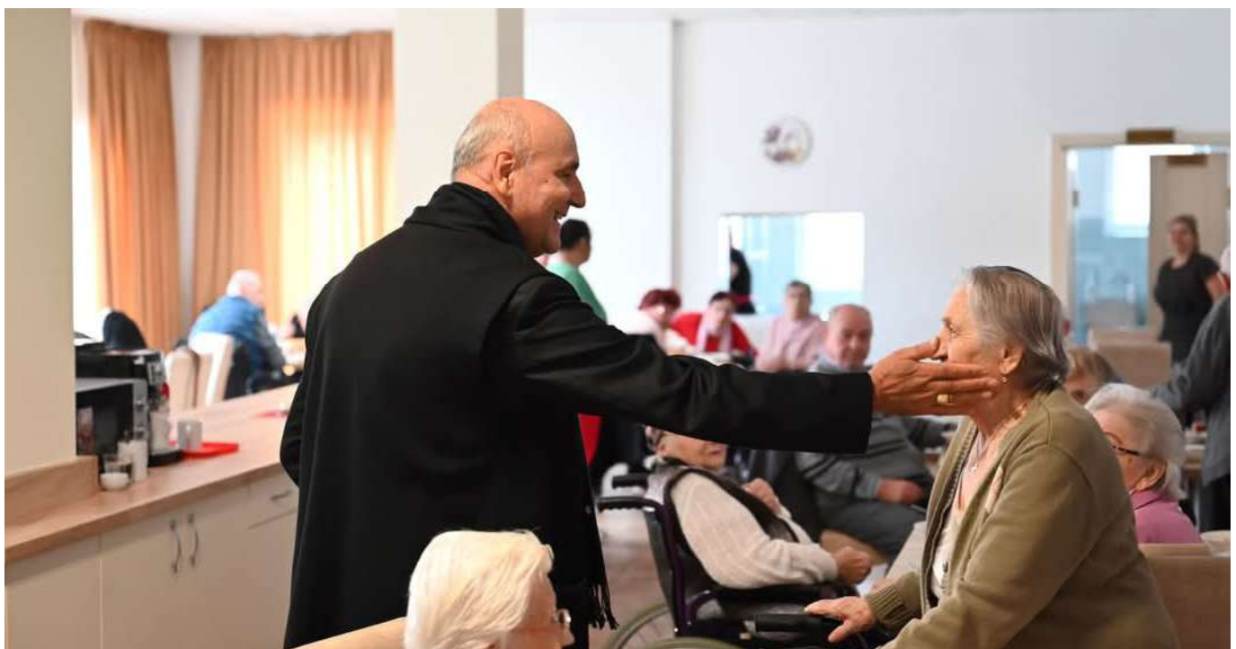
Traducere: Biroul de Presă EGCO